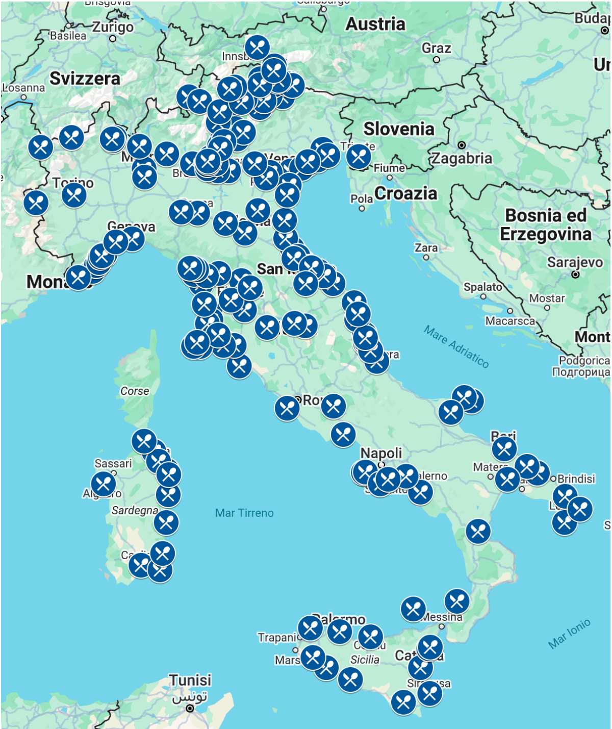
Tav. 1 - Distribuzione delle destinazioni turistiche con più alto valore aggiunto della ristorazione